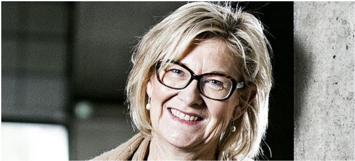
Artikeludpluk fra Fredericia Dagblad