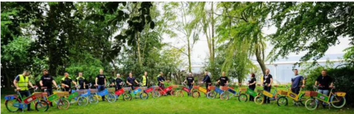
Artikel: Skrevet af Fredericia Avisen

Efter godt to års arbejde indvier Google i dag sit nye datacenter ved Fredericia.